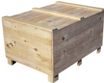
Cassa in legno compensato Plywood box